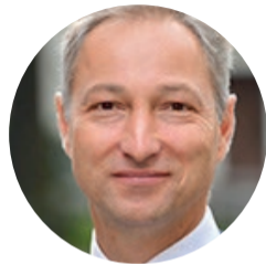
Premjerministrs Jānis Bordāns