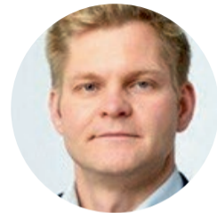
Ekonomikas ministrs Gatis Eglītis