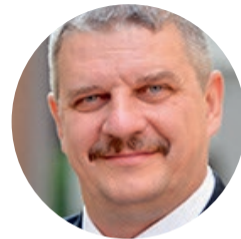
Aizsardzības ministrs Ainars Bašķis