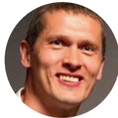
Labklājības un veselības ministrs Juris Jurašs