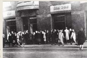
Rindā pie pārkāpes veikala, Rīga, 1960. gadi

No Padomju Savienības atbraukšie migranti – "mašīniski" Rīgas dzelzceļa stacijā. Šī jaunu kategoriju, kuras galvenais Latvijas apmeklējuma mērķis bija iepirkšanās un labāko dzīves apstākļu meklējumi, veidoja būtisku daļu no pusi miliona cīttautiešu, kuri pēckara gados apmetās uz dzīvi Latvijā.